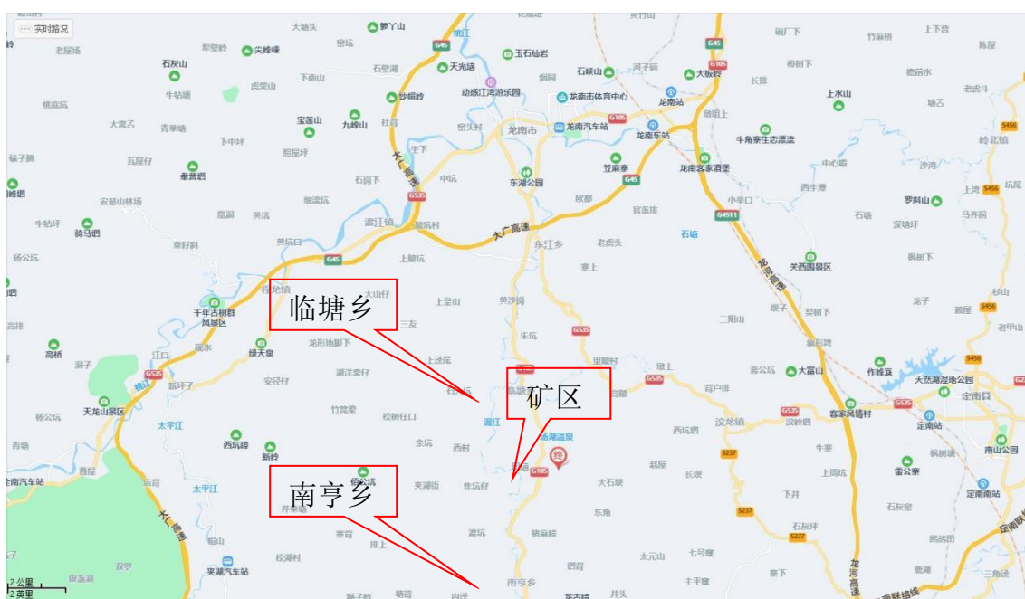
图 2-1 交通位置图